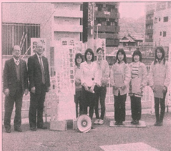
4月10日(水)、10時45分イズミヤ前、11時30分 関西スーパー前で党員の皆さんと署名活動 しました