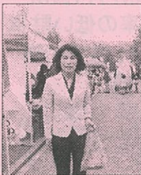
買い物をしました

悩んでいるように感じます。 ● 主催者は、企画面だけでなく、チラシ等にも工夫されていますが、どうすれば多くの市民に会場へ足を運んでくださる